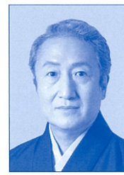
なかむらきんのすけ 中村錦之助