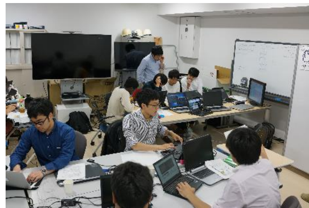
グループで演習の実施・討論